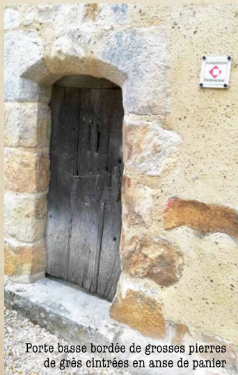
Porte basse bordée de grosses pierres de grès cintrées en anse de panier

La famille Lecoq puis sept générations, propriétaires et exploitants du colombier, se succèdent. Après eux, la ferme, dont dépend le colombier, entre dans la famille Moret.