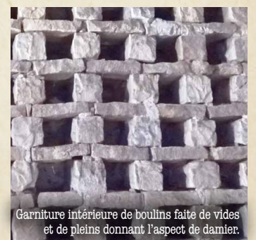
Garniture intérieure de boulins faite de vides et de pleins donnant l'aspect de damier.