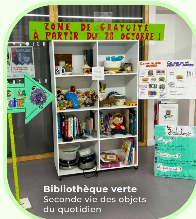
Bibliothèque verte Seconde vie des objets du quotidien