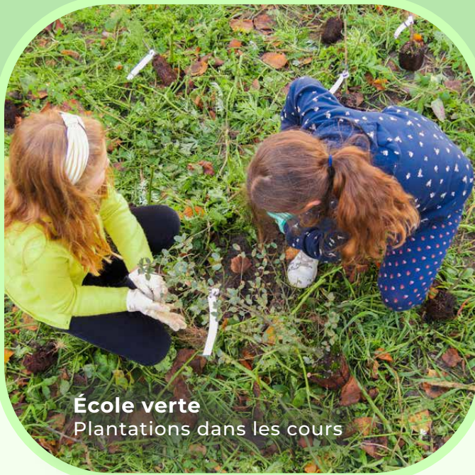
École verte Plantations dans les cours