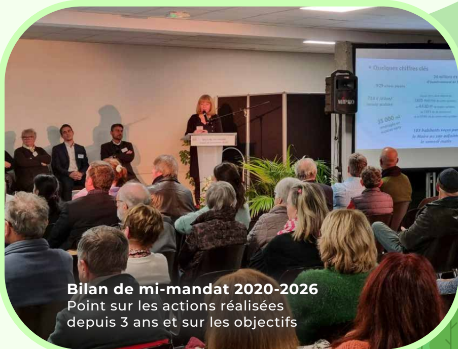
Bilan de mi-mandat 2020-2026 Point sur les actions réalisées depuis 3 ans et sur les objectifs