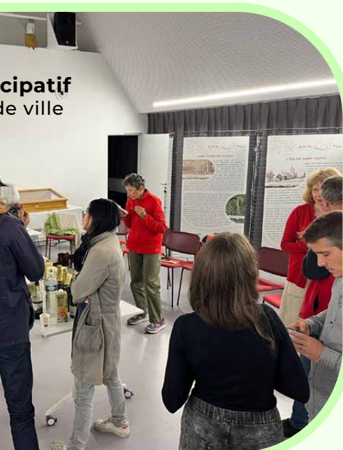
Participatif de ville