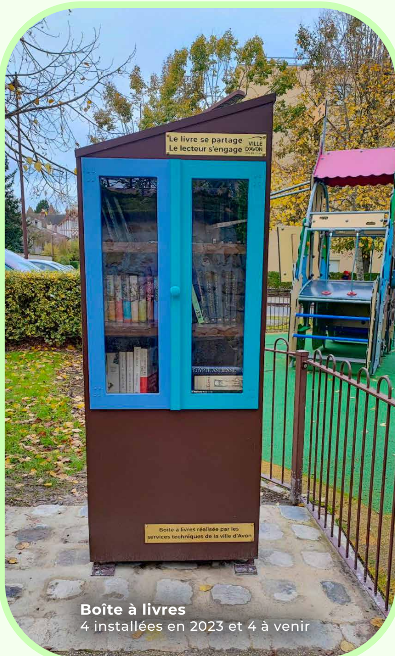
Boîte à livres 4 installées en 2023 et 4 à venir