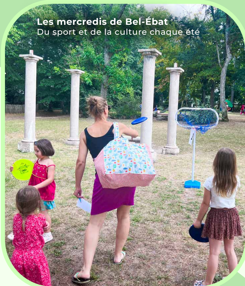
Les mercredis de Bel-Ébat Du sport et de la culture chaque été