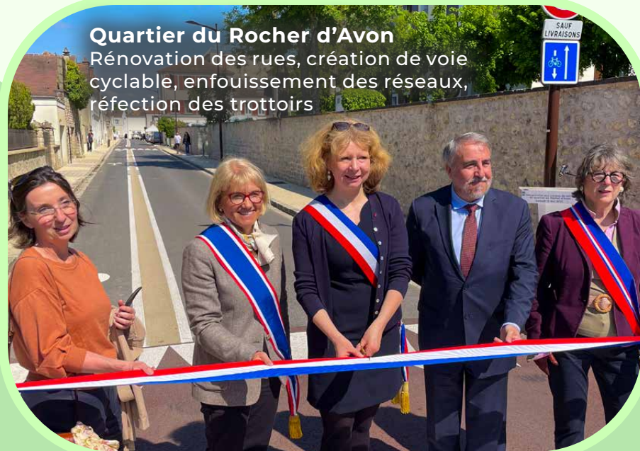
Quartier du Rocher d'Avon Rénovation des rues, création de voie cyclable, enfouissement des réseaux, réfection des trottoirs