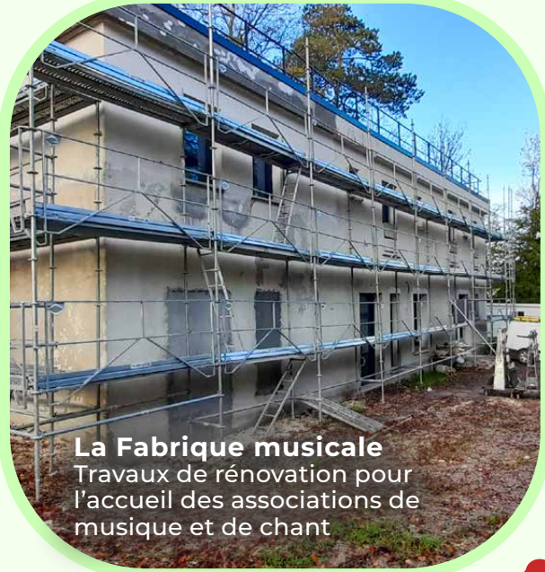
La Fabrique musicale Travaux de rénovation pour l'accueil des associations de musique et de chant