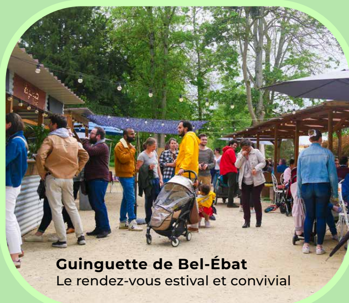
Guinguette de Bel-Ébat Le rendez-vous estival et convivial