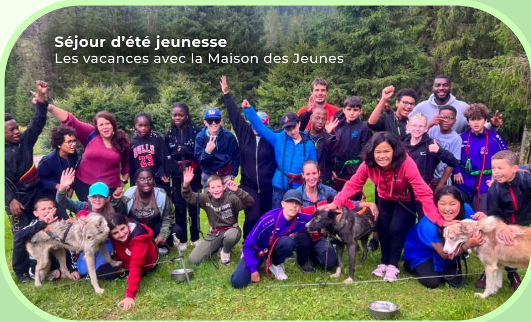
Séjour d'été jeunesse Les vacances avec la Maison des Jeunes