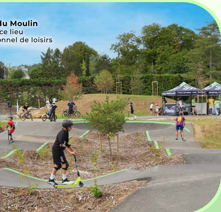
du Moulin ce lieu nnel de loisirs